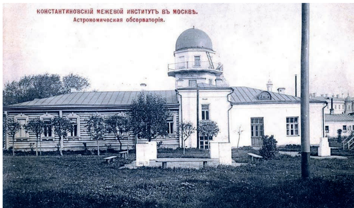
Рис. 5. Астрономическая обсерватория Константиновского межевого института Fig. 5. Astronomical observatory of the Konstantinovsky Land Surveying Institute

Столыпинская аграрная реформа 1906 г. выявила острую необходимость в большом