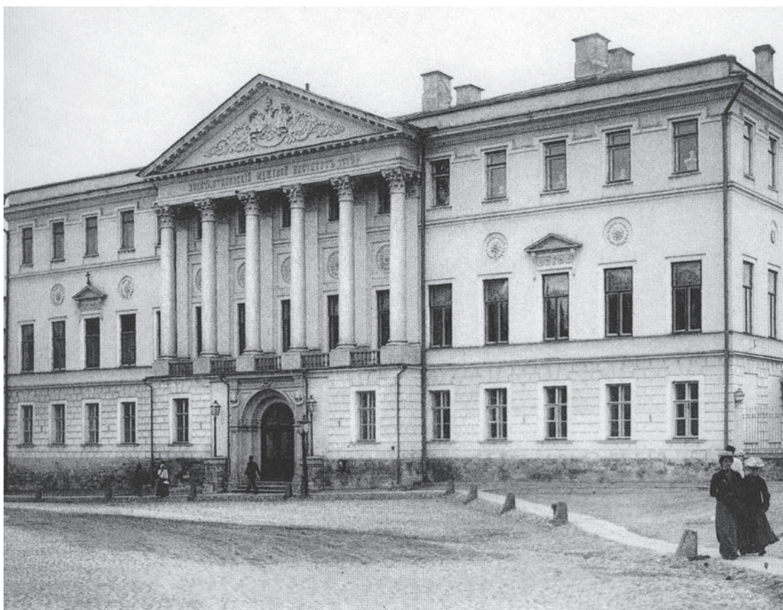
Рис. 1. Константиновский межевой институт Fig. 1. Konstantinovskiy Land Surveying Institute