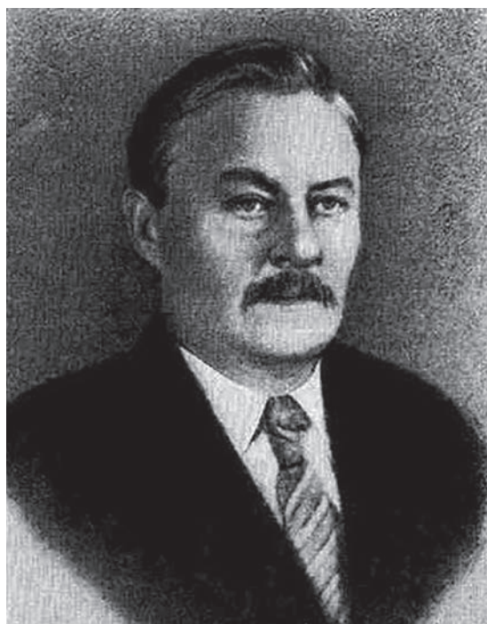
Рис. 8. Феодосий Николаевич Красовский, первый директор ГИГК Fig. 8. Feodosiy Nikolaevich Krasovskiy, first director of the GIGC