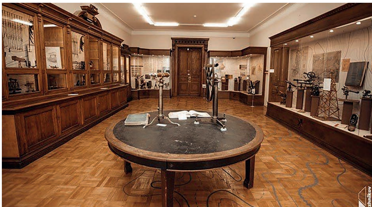
Рис. 6. Учебно-исторический центр университета МИИГАиК

Fig. 6. The educational and historical center of the university of MIIGAik