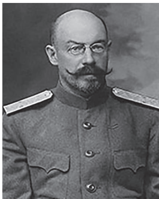
Рис. 7. Михаил Дмитриевич Бонч-Бруевич, российский и советский партийный и государственный деятель

впоследствии (1933 г.) – Центральный научно-исследовательский институт геодезии, аэросъемки и картографии (ЦНИИГАиК). Первым директором ГИГК