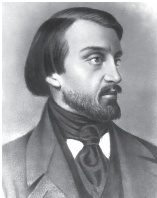
Рис. 3. Виссарион Григорьевич Белинский, преподаватель Константиновского межевого института, литературный критик Fig. 3. Vissarion Grigorievich Belinsky, lecturer at the Konstantinovskiy Land Surveying Institute, literary critic