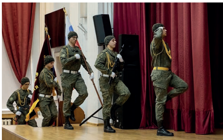
Рис. 4. День защитника отечества 2024 г. Fig. 4. Defender of the Fatherland Day 2024

вития мелиоративного комплекса Российской Федерации 3 специалистами университета по заказу Министерства сельского