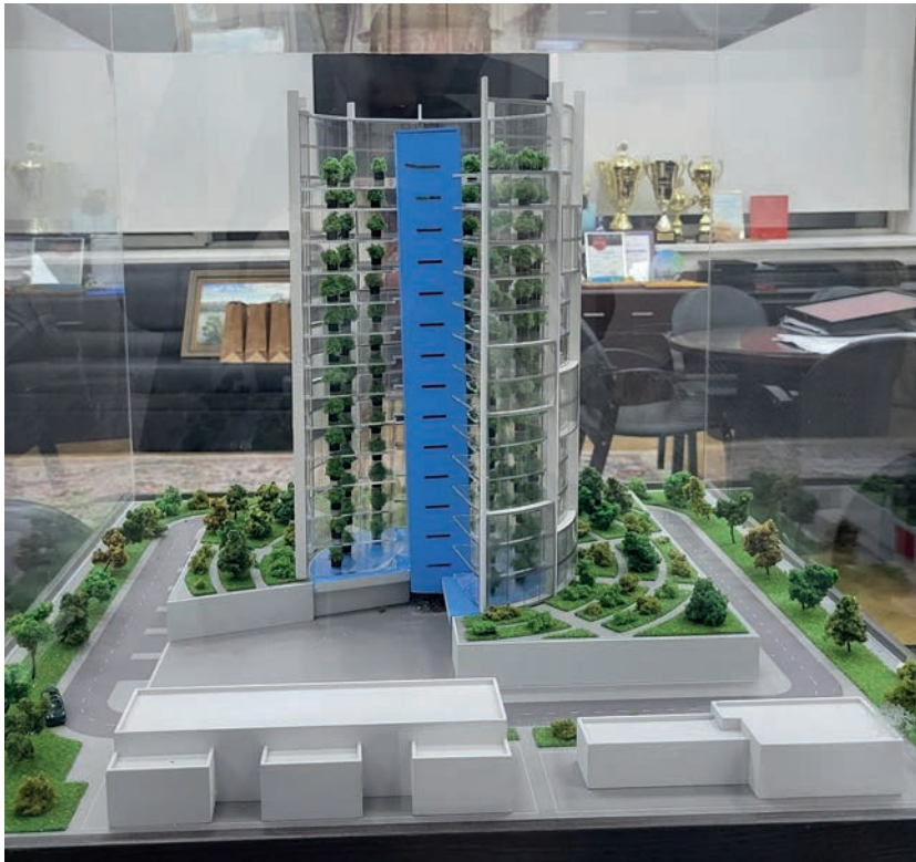
Рис. 7. Разработка ученых ГУЗ – вертикальная ферма Fig 7. The development of University scientists is a vertical farm

раты. Развитие кластера создаст возможности на более высоком научно-техническом уровне выполнять разработки в сфере геоинформационных моделей мониторинга экологической оценки земель на основе цифровых картографических баз данных с применением технологий дистанционного зондирования Земли; использовать материалы мультиспектральных аэро- и космических съемок при экологическом мониторинге мелиорированных земель; моделировать рельеф по материалам аэро- и космических съемок в целях рекультивации мелиорированных земель, а также другие перспективные наукоемкие разработки [8];