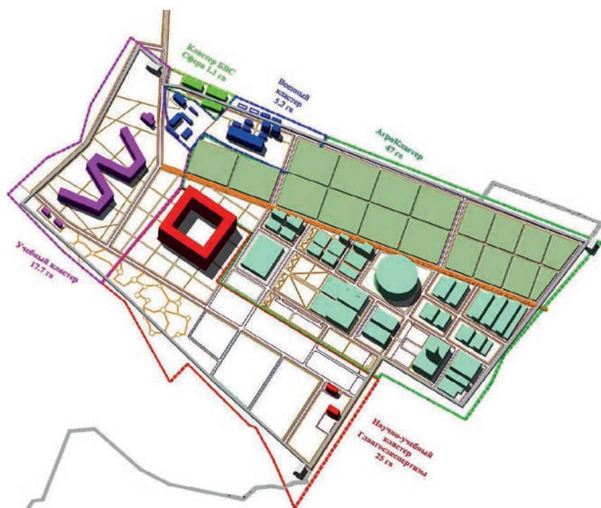
Рис. 6. Проектируемое зонирование территории Агро(био)технопарка «Чкаловский» на кластеры и функциональные зоны

БВС (беспилотные воздушные суда) «Сфера». Наличие этого кластера позволит Университету не только обучать студентов и иных слушателей управлять БВС и разрабатывать для них интеллектуальные системы, но и сертифицировать летательные аппа-