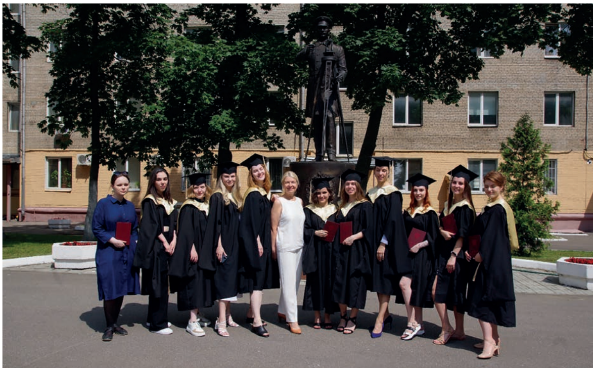
Рис. 3. Выпускники университета