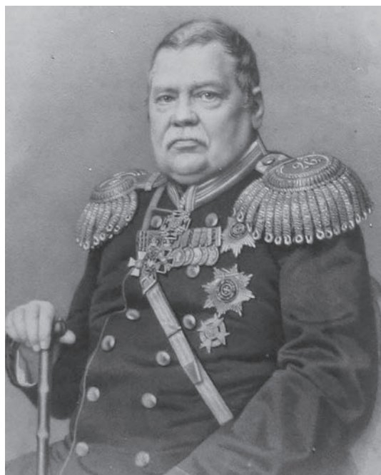
Рис. 4. Граф Михаил Николаевич Муравьев, российский государственный и военный деятель Fig. 4. Count Mikhail Nikolaevich Muravyov, Russian statesman and military figure

способовавшим всестороннему развитию целостной гармоничной личности.