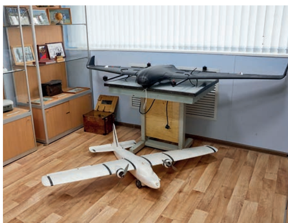
Рис. 5. Экспозиция Музея истории землеустройства Fig 5. Exposition of the Land Management History Museum

студентов (рис. 4). При вузе успешно функционирует военный учебный центр для обучения студентов по программам подготовки офицеров, сержантов и солдат запаса инженерных войск. Проводится наращивание его учебно-материальной базы, расширение основных и дополнительных программ по военно-учетным специальностям (обучение применению беспилотных воздушных судов для нужд Министерства обороны Российской Федерации).