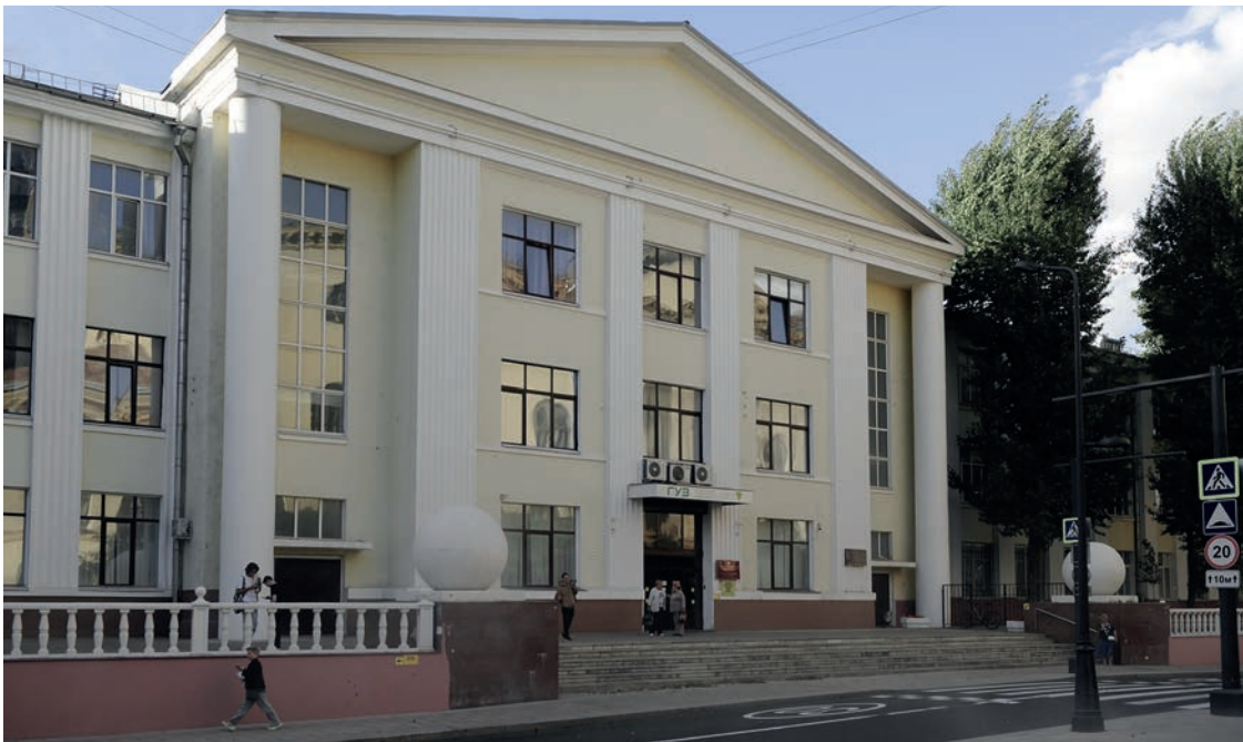
Рис. 2. Государственный университет по землеустройству (Москва, ул. Казакова, д. 15)