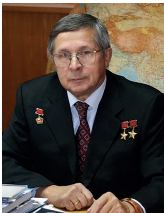
Рис. 10. Виктор Петрович Савиных, президент университета МИИГАиК

Научные разработки МИИГАиК направлены на обеспечение обороны и безопасности государства, а также экономического развития: